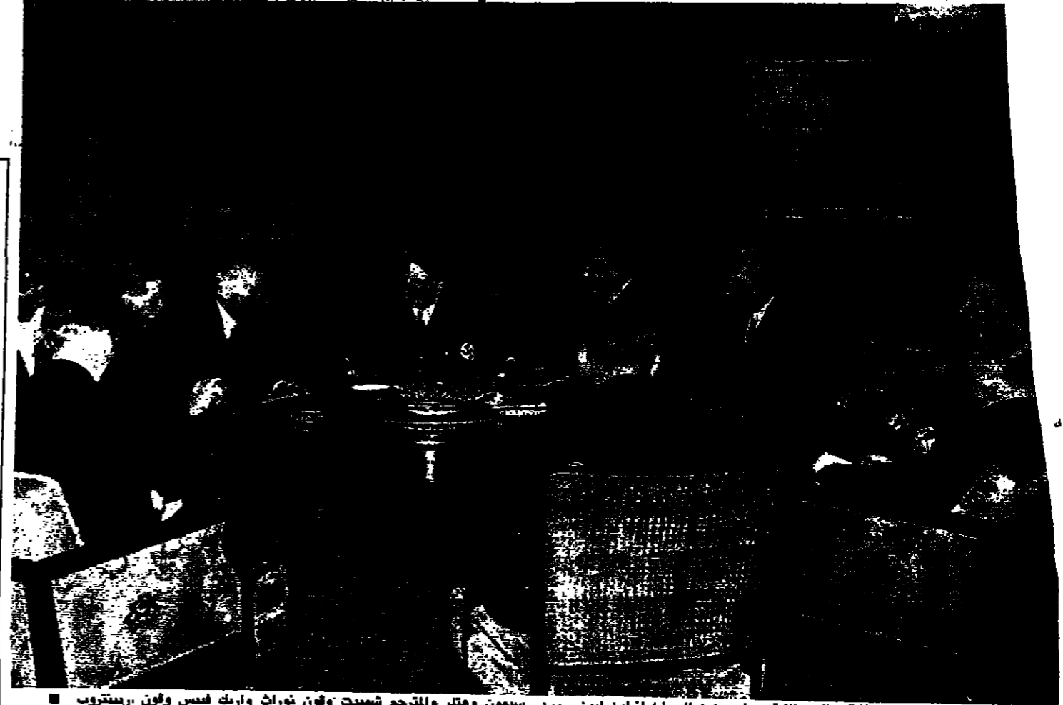
الطولة العسكرية الألمانية - البريطانية ، ونرى (من اليسار) انطون اينن وجون سيمون وهتكر والمترجم شميدت وفون ثورث وارنيك فييس وفون ريبنتروب